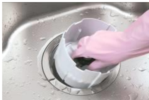
洗しやすいバスケット