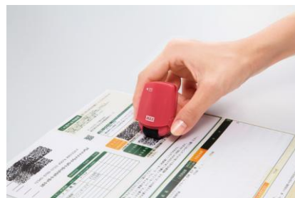
ローラー式個人情報保護スタンプ