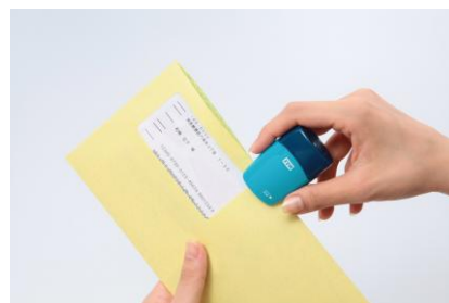
レターオープナー機能