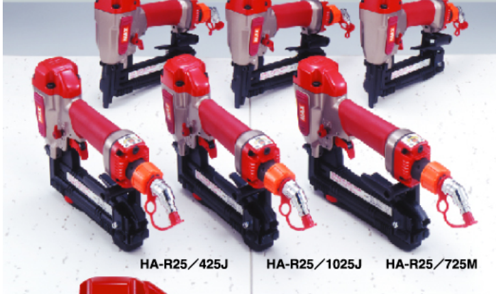
HA-R25/425J HA-R25/1025J HA-R25/725M