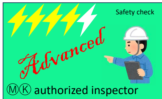
上級者A(経験10年以上20以上)