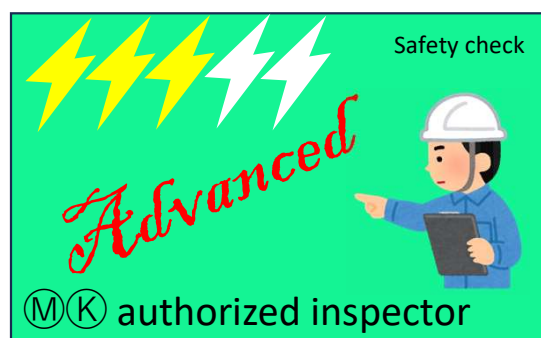
上級者B(経験5年以上機種15以下)