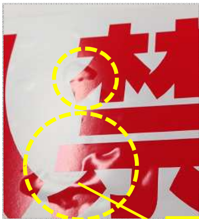
ビーポップボード