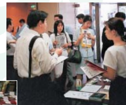
従業員の参画によるエコロジー事務用品の選定