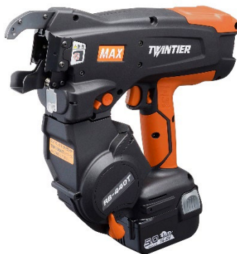
タンジェリンオレンジ

マックス株式会社(証券コード:6454)は、会社創立80周年を記念し、限定カラーの充電式鉄筋結束機「ツインタイア」シリーズを7月25日(月)から全国の鉄筋関連・資材・金物ルートを通じて数量限定で販売します。カラーは、コーポレートカラーを意識した鮮やかな「タンジェリンオレンジ」と、力強い印象が屋外作業に映える「ミリタリーグリーン」の2色で、対象機種は「RB-440T」と「RB-610T」です。