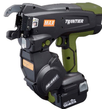
ミリタリーグリーン