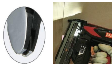
コンタクトノーズ