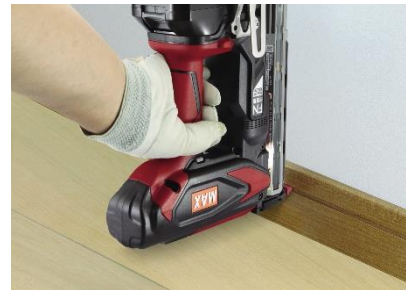
巾木溝打ち作業イメージ